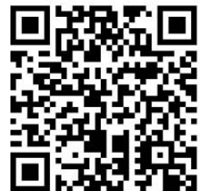
携帯用 QR コード